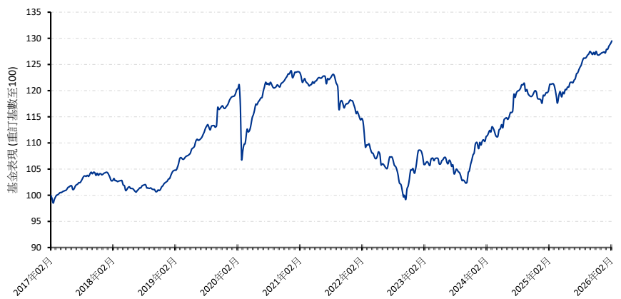
A 美元 (累積)